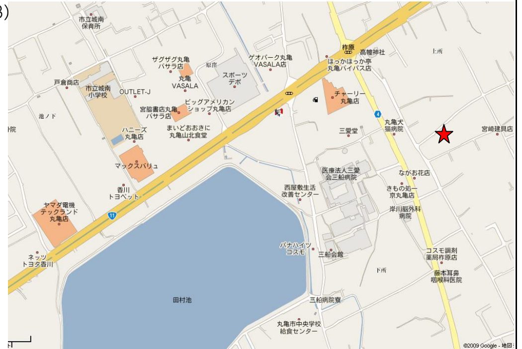
周辺地図 ゼンリン63(1-3)

アパマンショップ丸亀店 (有)コスモ不動産 〒763-0033 丸亀市中府町3丁目1番1号 フリーダイヤル 0120-34-8000 FAX 0877-25-0863 http://www.cosmo2103.com info@cosmo2103.com 月～土am9:00～pm7:00 日・祝am10:00～pm7:00