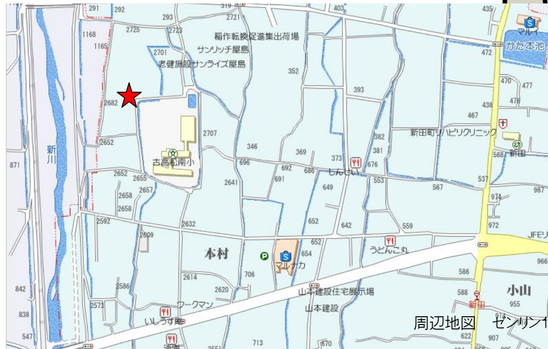
周辺地図 センター104(G-4、5)